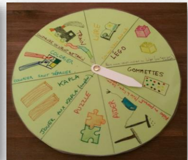
Arthur Moyenne Section